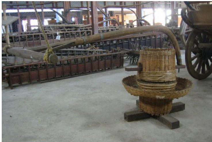
ภาพที่ ๓ : เครื่องมือหัตถกรรมพื้นบ้าน

จึงต้องคิดหาวิธีแก้ปัญหาโดยการนำไม้ไผ่มาเหลาเพื่อใช้ขัดและเป็นแบบพื้นบ้าน มีพระ มีเณร มีเด็กวัด และมีชาวบ้านที่มาช่วย โดยทางพิพิธภัณฑ์มีวัตถุประสงค์เพื่อที่จะอนุรักษ์มรดกพื้นบ้านเหล่านี้ไว้ให้เป็นแหล่งเรียนรู้เกี่ยวกับวัฒนธรรมพื้นบ้านของคนไทยในอดีตแก่นักเรียน นักศึกษา และผู้สนใจทั่วไป