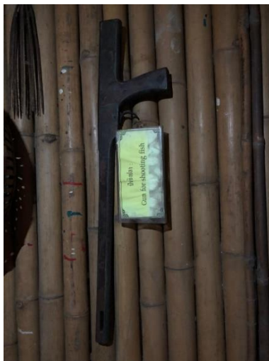
ภาพที่ ๑๑ ปืนยิงปลา (Gun for shooting fish)

ข้อมูล/คำอธิบายเพิ่มเติม : ใช้สำหรับยิงปลาปืนโจมตีเน้นความรุนแรง โดยปืนชนิดนี้จะเป็นปืนเน้นแรงโจมตีสูงและยิงไว แต่ก็มีข้อจำกัดคือ กระสุนจะไม่สามารถทะลุตัวปลาได้