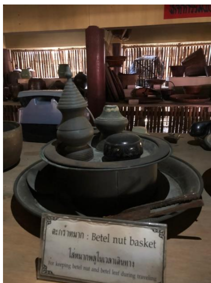
ภาพที่ ๗ ตะกร้าหมาก (Betel nut basket)

ข้อมูล/คำอธิบายเพิ่มเติม : ใส่หมากพลูในเวลาเดินทาง : For keeping betel nut and betel leaf during traveling