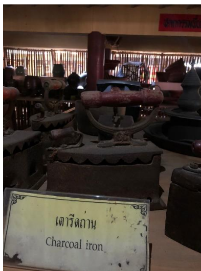
ภาพที่ ๑๓ เตารีดถ่าน (Charcoal iron)

ข้อมูล/คำอธิบายเพิ่มเติม : ใช้สำหรับรีดเสื้อผ้าโดยการนำถ่านใส่ไว้ตรงด้านในตัวของเตารีด