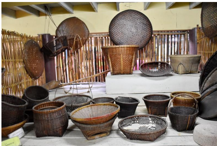
ภาพที่ ๑ : เครื่องมือหัตถกรรมพื้นบ้าน

พิพิธภัณฑ์พื้นบ้านวัดสำโรงริเริ่มก่อตั้งโดยเจ้าอาวาสวัดสำโรง พระครูสิริปัญญาภิวัตน์ เมื่อปี พ.ศ. ๒๕๔๒ พระครูสิริปัญญาภิวัตน์ เจ้าอาวาสวัดสำโรงร่วมกับชาวบ้านชุมชนวัดสำโรงและชุมชนใกล้เคียงได้ร่วมกันบริจาคเครื่องมือเครื่องใช้ในการดำรงชีวิตและการประกอบอาชีพ ได้แก่ อุปกรณ์ที่ใช้ในการประกอบอาหาร เครื่องมือหัตถกรรมต่างๆ อุปกรณ์ตวงข้าว เครื่องมือจับสัตว์น้ำและเครื่องใช้อื่นๆ อีกเป็นจำนวนมาก โดยทางพิพิธภัณฑ์มีวัตถุประสงค์เพื่อที่จะอนุรักษ์มรดกพื้นบ้านเหล่านี้ไว้ให้เป็นแหล่งเรียนรู้เกี่ยวกับวัฒนธรรมพื้นบ้านของคนไทยในอดีตแก่นักเรียน นักศึกษา และผู้สนใจทั่วไป การจัดแสดง แบ่งเป็น ๒ อาคาร อาคารหลังแรกคือ อาคารของใช้พื้นบ้าน อาคารหลังที่ ๒ คือ อาคารอาชีพชาวนา จัดแสดงอุปกรณ์และเครื่องมือในการทำนา เช่น อุปกรณ์ในการไถหว่าน อุปกรณ์ในการตกกล้า อุปกรณ์ในการเกี่ยวข้าว-นวดข้าว ระเบิดขกมวย ระเบิดเครื่องยนต์ แป้นตอกกล้า ไม้หอบกล้า เครื่องฝัดข้าวครกตำข้าว อาจเรียกได้ว่าความโดดเด่นของพิพิธภัณฑ์แห่งนี้คือ วัตถุที่จัดแสดงที่เป็นเครื่องมือเครื่องใช้พื้นบ้านที่มีสภาพสมบูรณ์และหาชมได้ยากแล้วในปัจจุบัน นอกจากนี้ยังมีการแสดงเรือพื้นบ้านรูปแบบต่าง ๆ เช่น เรือบด เรือพาย เรือแปะ เรือมาด เรือจ้าง เป็นต้น