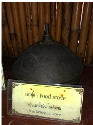
ภาพที่ ๖ ชื่อเต้าฟูด (Food stove)

ข้อมูล/คำอธิบายเพิ่มเติม : เป็นเตาน้ำมันก๊าดอัดลม : it is kerosene stove