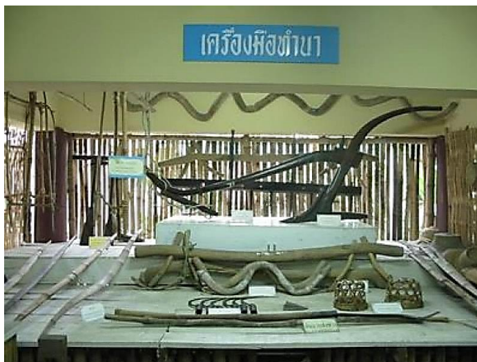
ภาพที่ ๒ : เครื่องมือหัตถกรรมพื้นบ้าน

ที่ใช้สำหรับดักสัตว์น้ำ และดักสัตว์บก, "เครื่องใช้เบ็ดเตล็ด" ส่วนมากเป็นเครื่องมือเครื่องใช้ในครัวเรือน เช่น เขียนหมากทองเหลือง ตะเกียงลาน นมนาง กลอนประตู แวนโรยขนมจีน เป็นต้น "เครื่องมือช่างไม้ประเภทต่างๆ" เช่น กบบุก กบซัดร่อง กบผิว กบบังใบ เลื่อยยก เลื่อยลันดา เป็นต้น รวมไปถึงเครื่องทองเหลืองต่างๆ