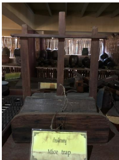
ภาพที่ ๑๒ กบดักหนู (Mice trap)

ข้อมูล/คำอธิบายเพิ่มเติม : ใช้สำหรับดักหนู