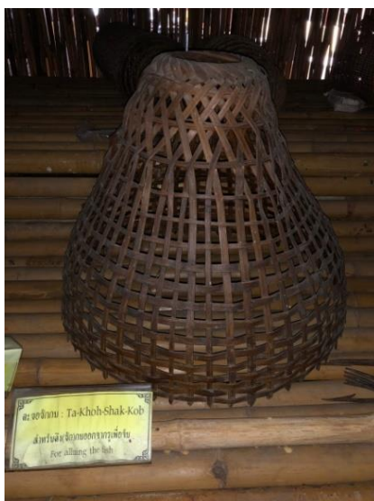
ภาพที่ ๔ ชื่อ ตะขอชักกบ (Ta-Khonh-Shak-Kob)

ข้อมูล/คำอธิบายเพิ่มเติม : สำหรับดึง (ชัก) กบออกจากรูเพื่อจับ : For alluing the fish