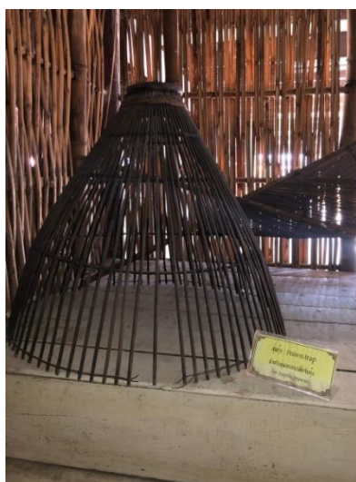
ภาพที่ ๘ สุ่มกุ้ง (Prawn-trap)

ข้อมูล/คำอธิบายเพิ่มเติม : สำหรับสุ่ม (ครอบ) เพื่อจับกุ้ง : For trapping prawns