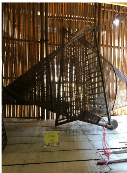
ภาพที่ ๙ ชนาง (Chanang)

ข้อมูล/คำอธิบายเพิ่มเติม : สำหรับช้อนกุ้ง : For trapping prawn